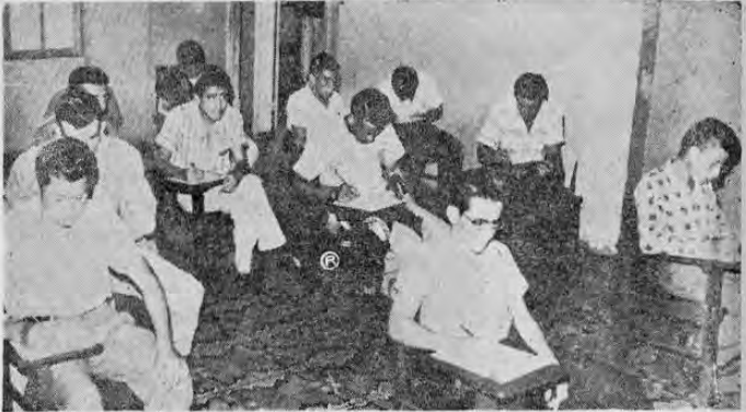
EXAMEN DE SUFICIENCIA. Los nuevos reclutas de la Guardia Civil son sometidos inmediatamente, luego se estudiarán las posibilidades de cada uno para prestar servicio en la Guardia Civil.

las más altas calificaciones en uno de los Fuertes de los Estados Unidos en la Zona del Canal, como experto en Guerrillas de la Selva.