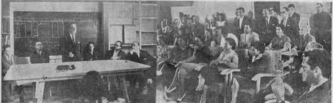
Ayer en la Maternidad Carit

Se espera que a más tardar a mediados de la semana entrante o finales de la misma entre en vigencia el Plan que contempla una estricta vigilancia en el área metropolitana y algunos cantones vecinos a San José. —(TEXTO EN PAGINA 11)—