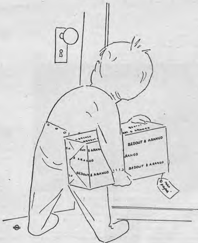
BEDOUT & ARANGO - 75 VARAS ESTE DE "LACSA" - TELEFONO: 4929 -